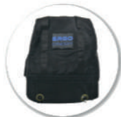
SAC DE PORTAGE