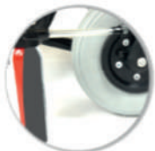
BOMBE ANTI-CREVAISON DRAP CHARGEMENT