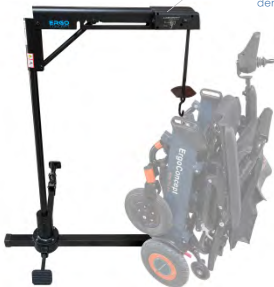
ERGO ATLAS 40

Longueur totale : 88 cm Largeur totale : 60 cm Structure : 5,4 kg Mât : 5,6 kg