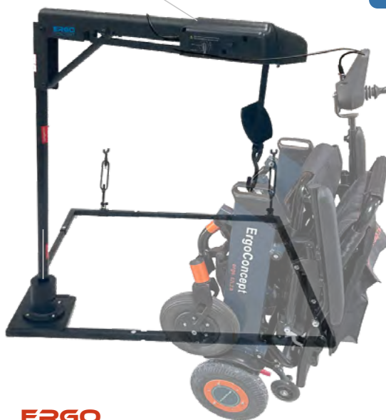
ERGO ATLAS 40 ISOFIX

Longueur totale : 88 cm Largeur totale : 60 cm Structure : 5,4 kg Mât : 5,6 kg