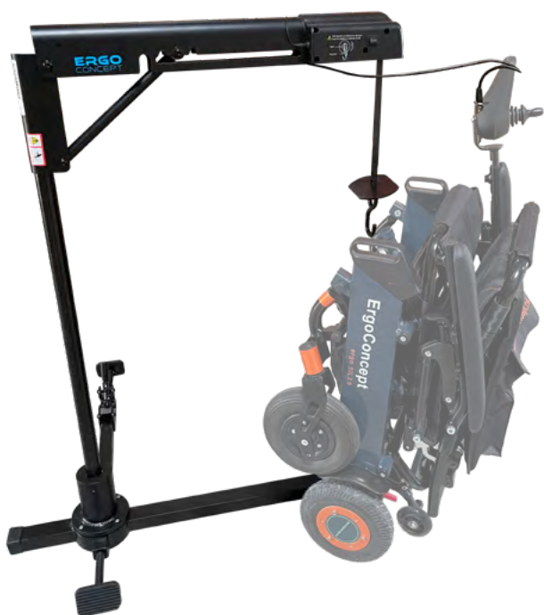
ERGO ATLAS 40