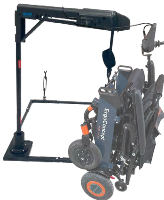
ERGO ATLAS 40 ISOFIX