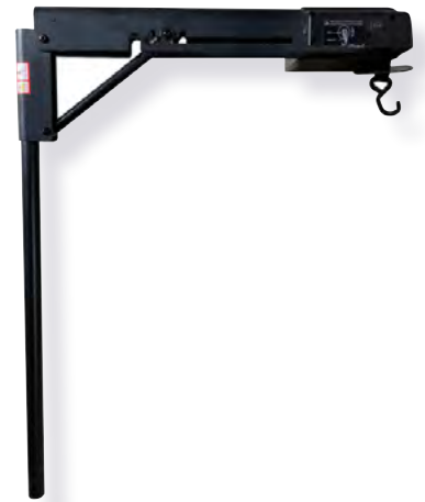
Mât / Potence