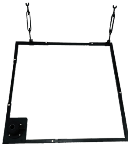
Base de fixation