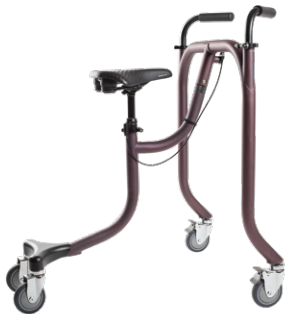
Hands-free Sit & Stand Walker Rollator mains-libres

Before operating the BiKube®, download and read the full user guide at www.bikube.com/instructions