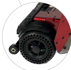
Pneus cellulaires pleins Roues anti-bascule