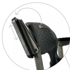
Accoudoirs réglables en hauteur et en inclinaison

Guidon et accoudoirs réglables En hauteur et inclinaison