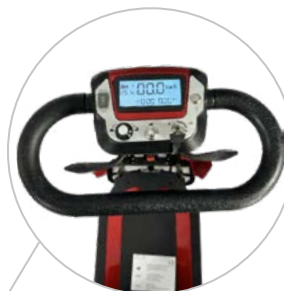
Guidon ergonomique Variateur de vitesse