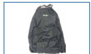
Housse de protection