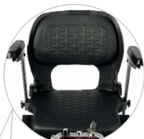
Dossier et Assise Confort