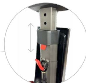
Réglage en hauteur et inclinaison