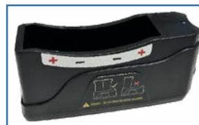
Station de charge