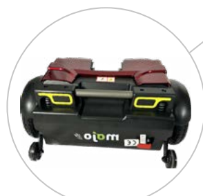
Bloc moteur démontable avec amortisseurs